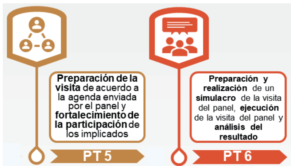
Figura 2: Fase 2: preparación de la visita del panel

Esta fase consistió en una metodología centrada en 2 Paquetes de Trabajo (PT), tal y como muestran la 2 y la Tabla 2.